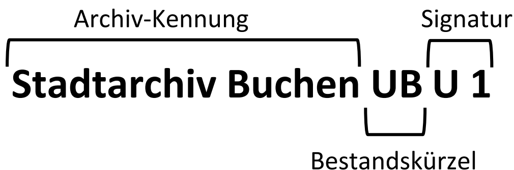
Abbildung 3: Aufbau der Archiv-Signatur des Stadtarchivs Buchen

Wie jedes andere Archiv arbeitet auch das Stadtarchiv Buchen mit einer sogenannten Archiv-Signatur. Diese dient zunächst einmal für die Verzeichnung und spiegelt dadurch auch die festgelegte innere Ordnung des Archivs wider. Ebenso können Archivbenutzer mittels der Archiv-Signatur gezielt Archivalien zur Einsicht im Stadtarchiv bestellen oder Auskünfte darüber erhalten. Darüber hinaus hat die Archiv-Signatur die Funktion der wissenschaftlichen Zitation innerhalb der Geschichtsforschung aber auch für populärwissenschaftliche Bücher und Artikel, deren Verwendung das Stadtarchiv nahelegt. Die Archiv-Signatur besteht aus drei Bausteinen, nämlich der Archiv-Kennung , dem Bestandskürzel und der eigentlichen Signatur für die einzelne Archivalie innerhalb des jeweiligen Bestandes.